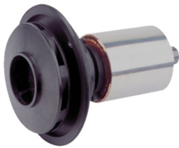
DRUCKSTARK: HYDRALISCH OPTIMIERTES LAUFRAD