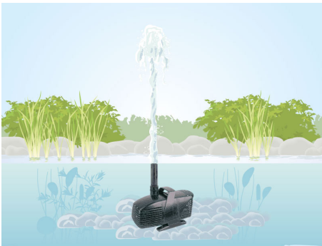
FÖRDERHÖHE BIS ZU 11,2 M